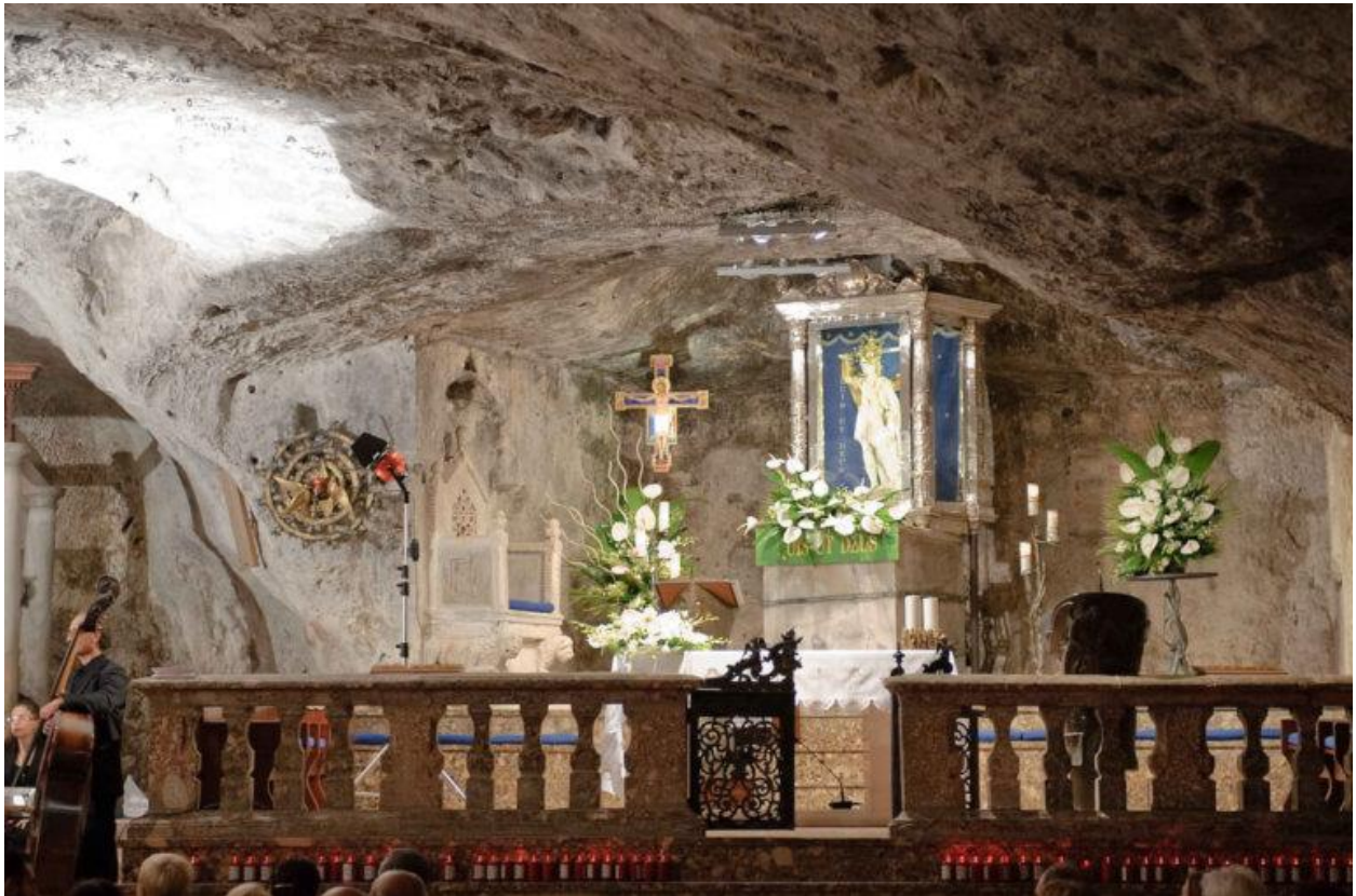
L-ARTAL CENTRALI TAL-BAZILKA TA' SAN MIKIEL

rnexxielu jikseb ftehim ta' tlett ijiem ta' waqfien mill-glied. Tul dawn il-jiem sam u talab b'fidi kbira. Fittielet jum dehrlu l-Arkanġlu u qallu li n-nies tal-belt kienu se jirbħu l-battalja. Dan il-messagg tant mela b'kuragg lin-nies tal-belt li ħargu u qerdu lill-għadu f'ħakka ta' għajn. Il-gellieda kienu msieħba minn dawl qawwi u ragħad.