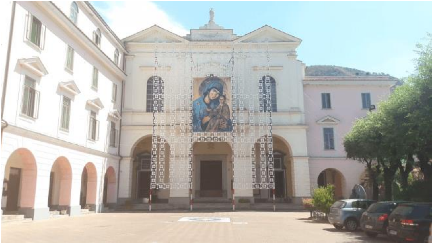
Id-dehra esterna tal-bazilka Materdomini