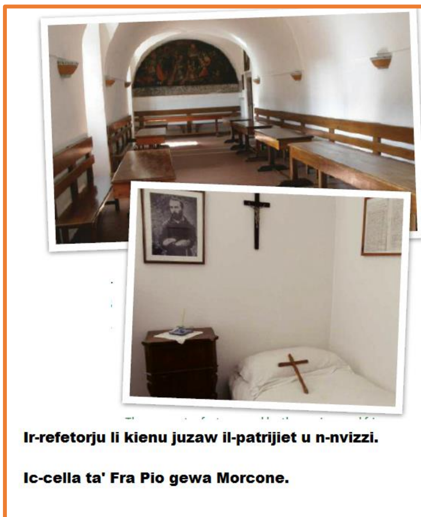
Ir-refetorju li kienu juzaw il-patrijiet u n-nvizzi.

Fil-Hdud u festi r-religjuzi kellhom il-permess li jitkellmu meta jkunu fir-refetorju qeghdin jieklu. F'dawn il-mumentu Padre Pio kien jiehu sehem attiv billi jirrakonta