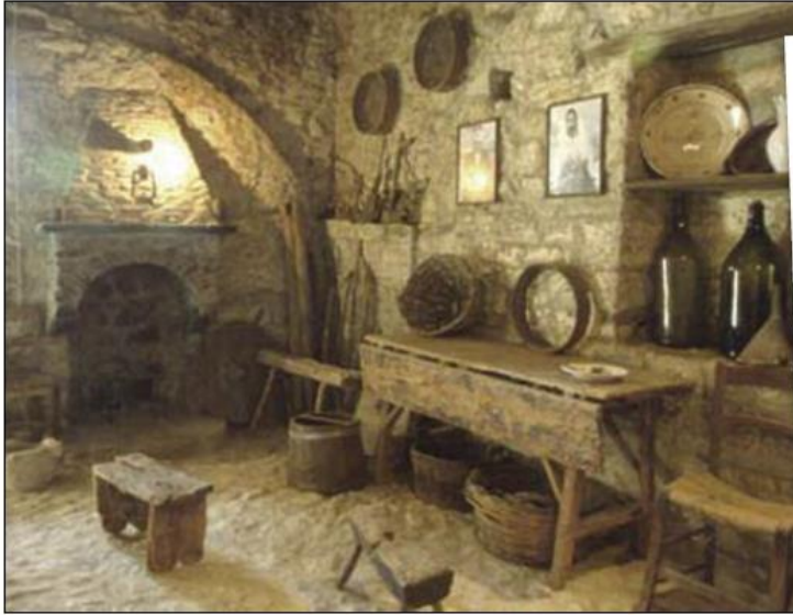
il-kcina tal-familja Forgiione