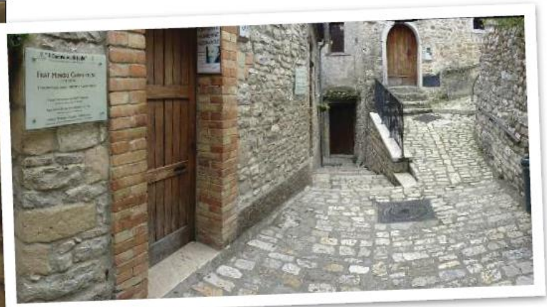
Id-dhul ghad-dar fejn twieled Padre Pio fuq l-gholja tar-rahaj ta' Pietrelcina

Id-dar fejn kienu joqghodu kienet tikkonsisti f'kamra wahda li kellha arja ta' 145 piedi kwadri u fl-istess triq imma separata minn bini ghola, propjeta' ta' familja ohra, kellhom parti ohra tad-dar li kienet tikkonsisti f'zewgt ikmamar: kcina u kamra tas-sodda.